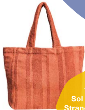
1 x Sol e mar Strandtasche