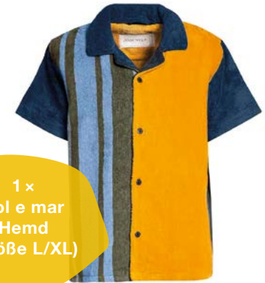
1 x Sol e mar Hemd (Größe L/XL)