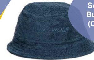
1 x Sol e mar Buckethat (Onesize)