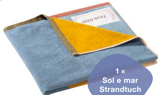
1 x Sol e mar Strandtuch