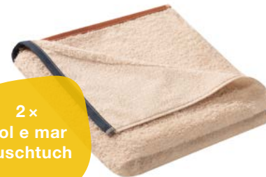
2 x Sol e mar Duschtuch