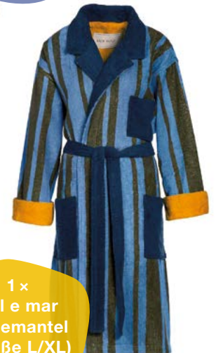
1 x Sol e mar Bademantel (Größe L/XL)